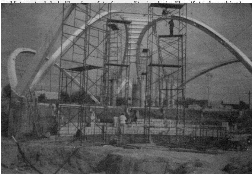
Construcción de la librería, cafetería y auditorio al cine libro (Foto de archivo)