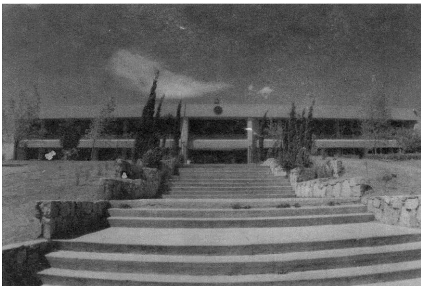
Entrada del libro cafetería y auditorio al cine libro